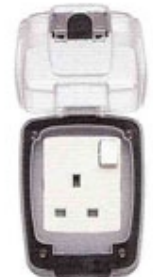
86486 TC GRY