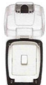
86401 TC WHI